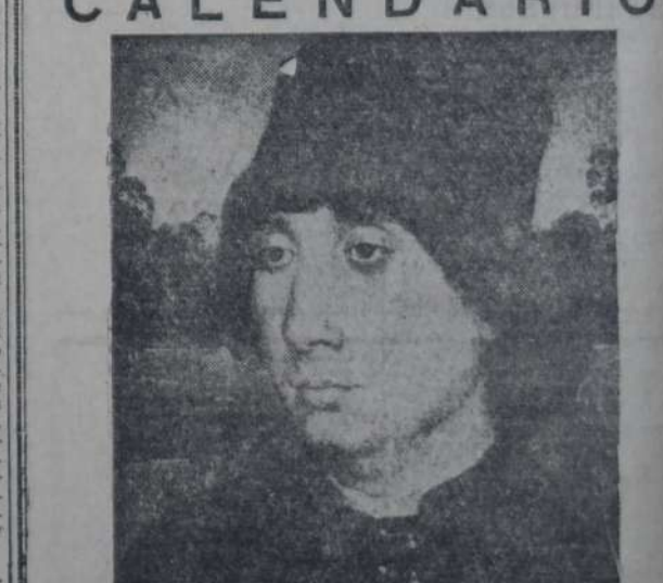
ANTONELLO DA MESSINA — "Retrato del desconocido".