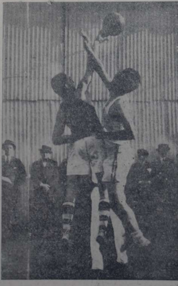
DISPUTANDESE LA PELOTA AL INICIARSE EL PARTIDO DE BASQUETBOL Sportivo Barracas v. Independiente.